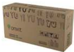
Картонная коробка 22,68kg (50Lb) Carton Box 22,68kg (50Lb)

All products are vacuum packed in foil bags in modified N 2 +CO 2 atmosphere.