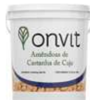
Пластиковое ведро 11,34kg (25Lb) Plastic Bucket 11,34kg (25Lb)