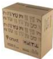
Картонная коробка 11,34kg (25Lb) Carton Box 11,34kg (25Lb)